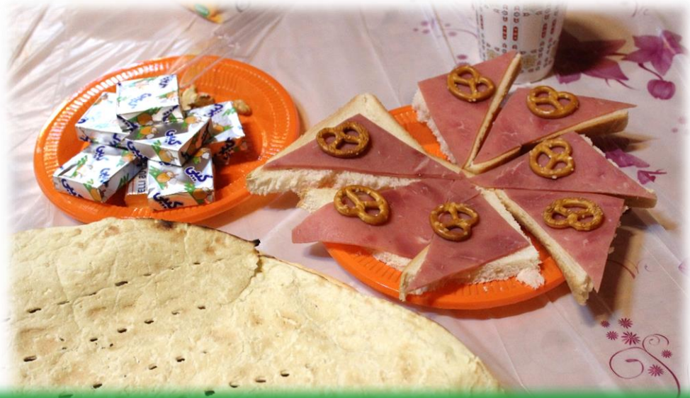
صبحانه وحدت (ویژه پایه سوم)